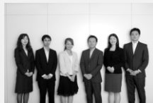
▲当事務所のスタッフ

弊社は、会計士1名、税理士6名含む9名の事務所です。税務処理については、結果が起こってからの処理をするのではなく、事前の相談により、クライアントへの影響やニーズにあった改善案を提案させていただくことにより、クライアントの要望にこたえることを心掛けております。ぜひ、一度ご相談いただければと思います。